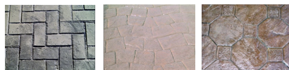
adobe en espiga